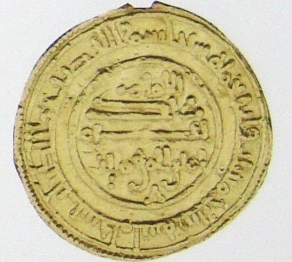
دينار مرابطي أبو بكر بن عمر ضرب: سجلماسة سنة: ٤٥٠ هجري

Murabeteen Dinar Abo-Bkre Bin Omar struck at SigilMasa Year: 450 H